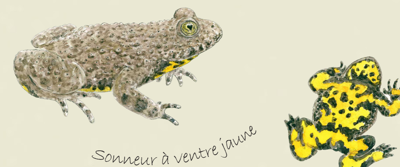
Sonneur à ventre jaune